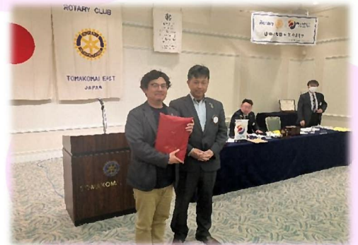
4月誕生日の堀会員

から10連休をエンジョイできちゃいます！日本の祝日の日数は1年に16日なので、祝日の4分の1が「ゴールデンウィーク」ということとなります。日本の「国民の祝日」というものは、ひとりひとりがより豊かな生活を送れるよう、「国民こそって祝い、感謝し、又は記念する日」と定められました。本年のGWは概ね天気恵まれる様ですので、皆様、色々ご計画されているかと思えます。