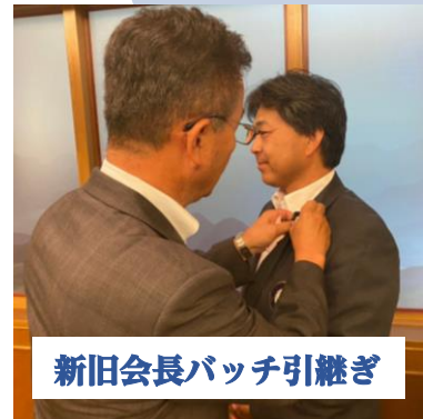
新旧会長バッチ引継ぎ