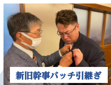
新旧幹事バッチ引継ぎ