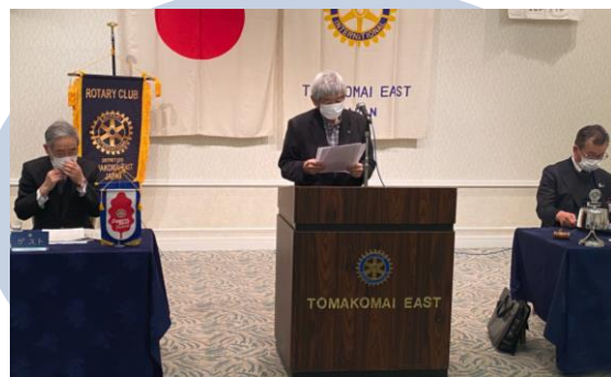
水野会員 紹介発表

の将来像を的確にとらえ、他社に先駆けて導入したCADシステムやヘリコプター搭載型精密航空レーザー等の新技術を積極的に取り入れたほか、測量調査主体の経営から建設関連総合コンサルタントへの移行も同時に取り組んできました。この間、会社の事業範囲は土木設計部門、補償コンサルタント部門、地質調査部門、埋蔵文化財調査部門、森林環境部門、情報システム部門に拡大し、昭和63年には社名を株式会社タナカコンサルタントに変更して、総合コンサルタント業としての道を着実に踏み出しました。平成15年には計量証明事業登録も行い環境関連事業にも展開しました。